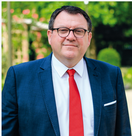
Franck Le Bohellec Maire de Villejuif Conseiller Régional d'Île-de-France

“ Face à cette crise sanitaire, je suis tous les jours à vos côtés pour vous accompagner dans cette période difficile. ”