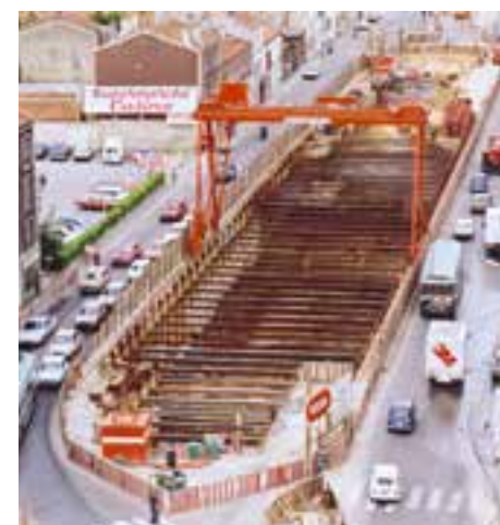
Chantier de construction du métro (station Léo-Lagrange), avenue de Paris, en juin 1982. 2Fi927.

La station Paul-Vaillant-Couturier est ornée d'une fresque réalisée par l'artiste villejuifois Nicolas Stavropoulos, rendant hommage à l'ancien député-maire de Villejuif. La station Léo-Lagrange a été entièrement rénovée sur le thème du sport pour le centenaire du métro en 2000. La station Louis-Aragon a été modernisée entre 2009 et 2012 en vue de l'arrivée du tramway.