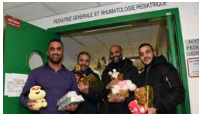
La Ville de Villejuif organisait avec les 18-25 ans « Un cadeau, un sourire, des étoiles » : des jouets collectés auprès des habitants ont été offerts aux enfants hospitalisés. L'équipe jeunesse accompagnait les jeunes, ici le 23 décembre, à l'hôpital du Kremlin-Bicêtre.