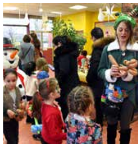
Petit déjeuner festif avec l'association Anim'too dans le cadre du Festinoël à la MPT Jules-Vallès