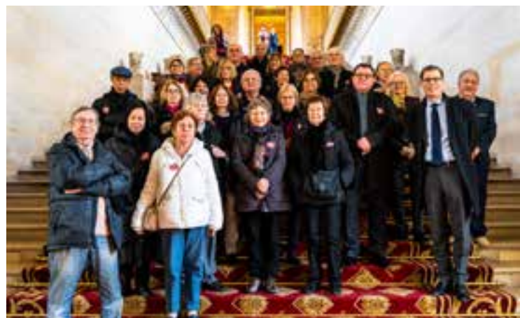
Mardi 3 décembre, les seniors ont eu le privilège de découvrir le Sénat à l'invitation du Sénateur Laurent Lafon.