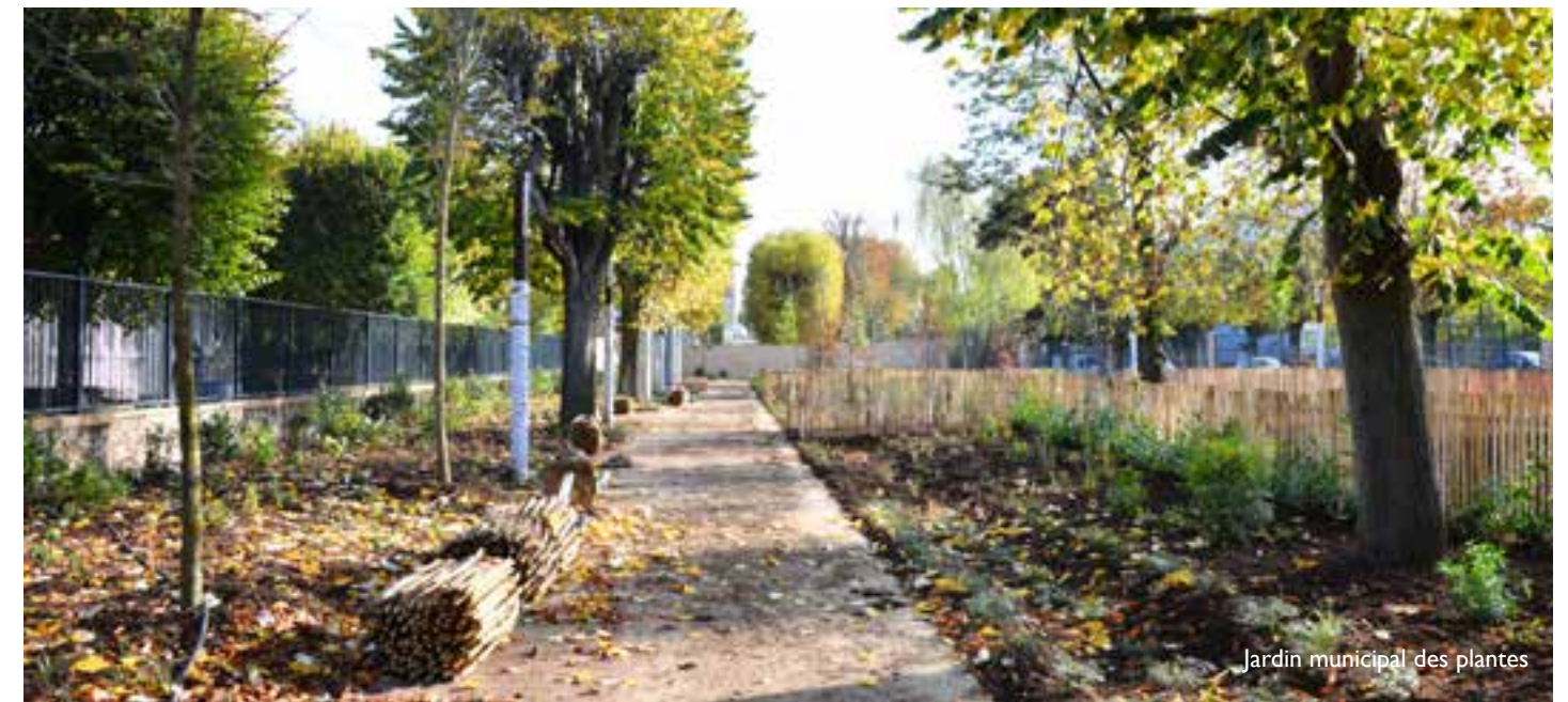
Jardin municipal des plantes

Au cours de la visite j'ai pu apprécier les nouveaux aménagements urbains et floraux ainsi que la propreté des rues, critère relevé en