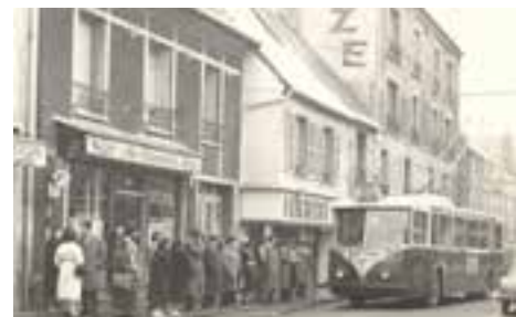
Trolleybus 185, rue Jean-Jaurès, en décembre 1958. Tramway 85 liaison Châtelet-Villejuif. 2Fi910.

Le 30 avril 1933, la ligne d'autobus 85 Châtelet-Porte d'Italie est prolongée jusqu'à Villejuif en remplacement du tramway. En 1945, la ligne prend l'indicatif 185. Elle est électrifiée en 1953. L'autobus 185 devient alors un trolleybus.