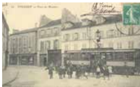
Place du Moutier (actuelle place des Fusillés). Tramway 85 liaison Châtelet-Villejuif. Carte postale. 5Fi248.t

En décembre 1907, la Compagnie générale parisienne des tramways achève l'électrification de ses lignes de la banlieue sud et notamment la ligne 85 reliant Châtelet à Villejuif.