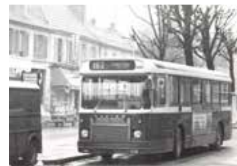
Autobus 162 au terminus, rue Jean-Jaurès, en 1980. 2Fi915.

La Ligne 162 de Villejuif à Clamart hôpital est créée le 22 janvier 1962. Elle est prolongée en 1988 jusqu'à Meudon Val Fleury RER.