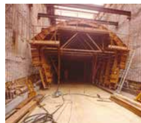
Coffrage du tunnel en octobre 1980. 2Fi931.