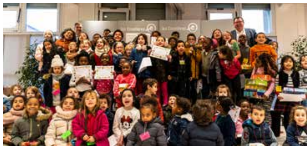
Mercredi 4 décembre, les enfants des accueils de loisirs ont été félicités et récompensés pour leurs décorations du sapin de Noël de la Semgest.