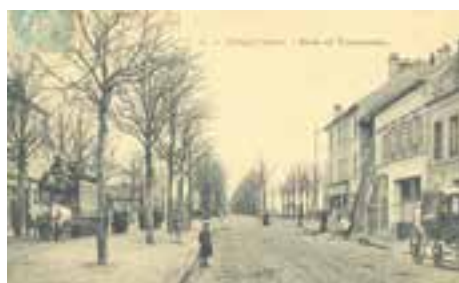
Tramway à chevaux, route de Fontainebleau (vers 1905). Carte postale. Coll. Archives communales. 5Fi325.

Malgré les protestations du conseil municipal et une pétition des Villejuifois, la ligne de tramways n°4 ouvre le 14 septembre 1876 entre le square de Cluny et le nord de Villejuif.