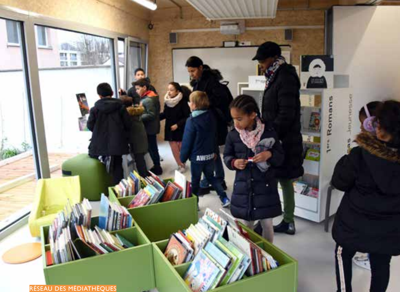
RÉSEAU DES MÉDIATHÈQUES