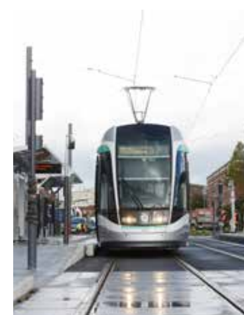
Le tramway T7 à la station Lamartine. Octobre 2013.

Les travaux débutent en 2009 en même temps que la requalification de la RD-7. La ligne de tramways T7 est inaugurée à Villejuif le 16 novembre 2013.