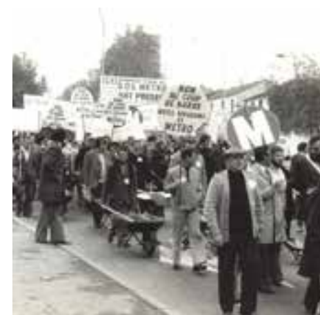
Manifestation pour la construction du métro le 7 novembre 1976. 2Fi917.

Dès 1923, puis en 1946, le conseil municipal demande à ce que Villejuif soit reliée à Orly par le chemin de fer, puis par le métropolitain, en raison du développement à venir pour ce secteur encore mal desservi. Pétitions, manifestations, interventions des élus, courriers adressés aux ministères finiront par être couronnés de succès après 40 années de luttes intensives.