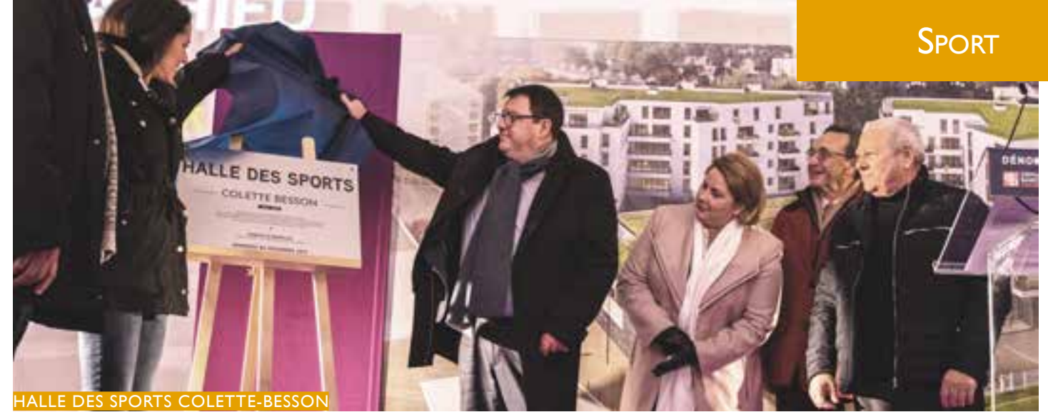
HALLE DES SPORTS COLETTE-BESSON