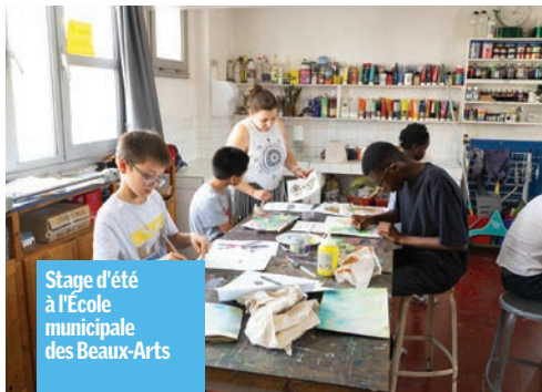
Stage d'été à l'École municipale des Beaux-Arts