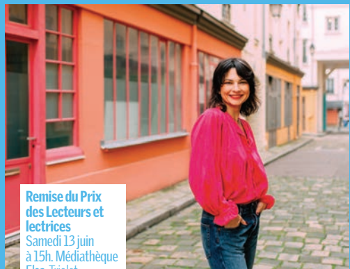
Remise du Prix des Lecteurs et Lectrices Samedi 13 juin à 15h. Médiathèque Elsa-Triolet