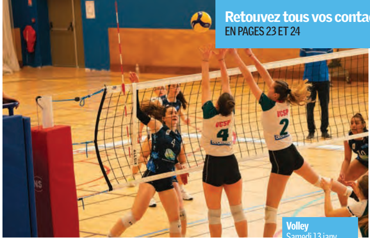
Volley Samedi 13 janv. à 18h30 Gymnase Daniel-Féry